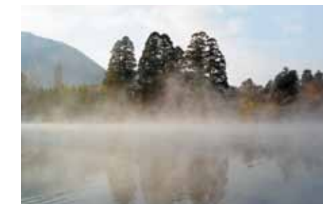
幻想的な表情を見せる金鱗湖