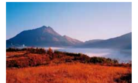
四季を通して美しい由布岳